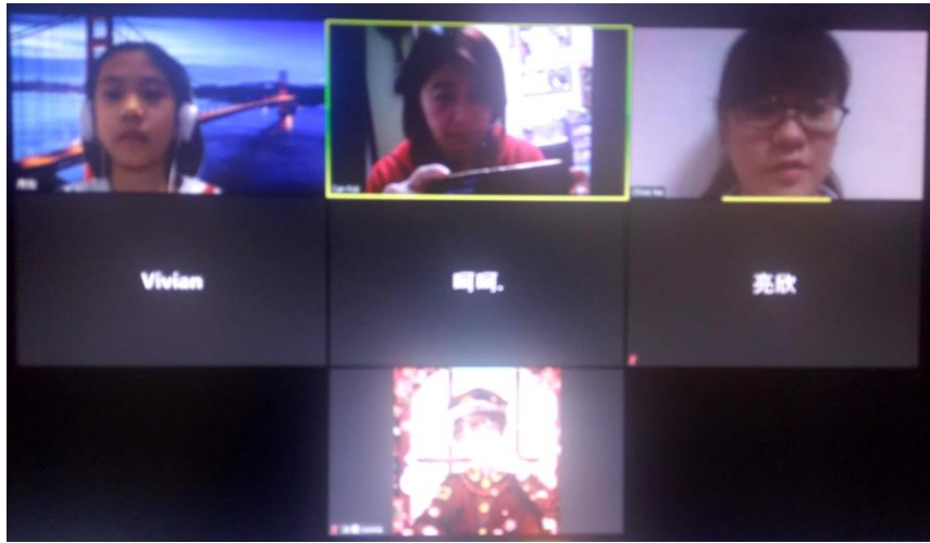
Hallelujah 小組 用 Zoom 時的 開組情況。